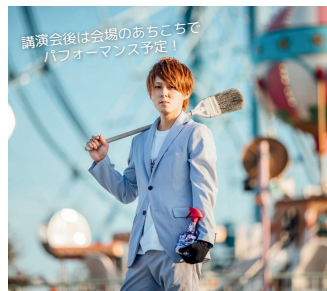
講演会後は会場のあちこちで パフォーマンス予定！