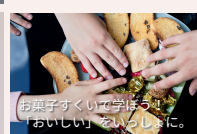
お菓子づくりで学ぼう。 「おいしい」をいっしょに。