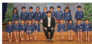
社会福祉法人須恵保育園様