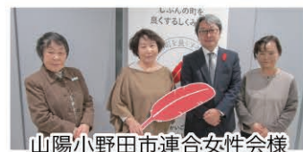
山陽小野田市連合女性会様