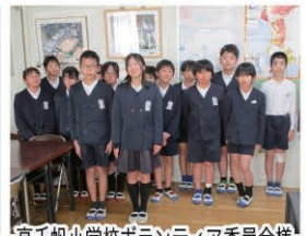
高千帆小学校ボランティア委員会様