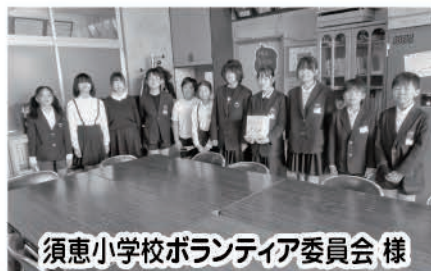
須恵小学校ボランティア委員会様