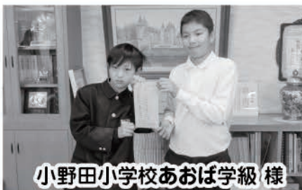
小野田小学校あおば学級様