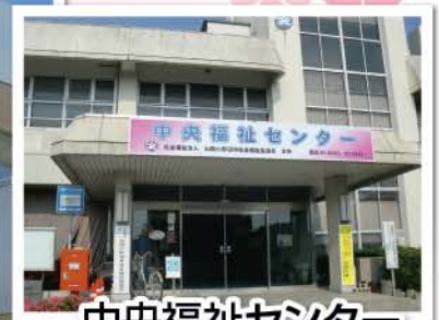
中央福祉センター