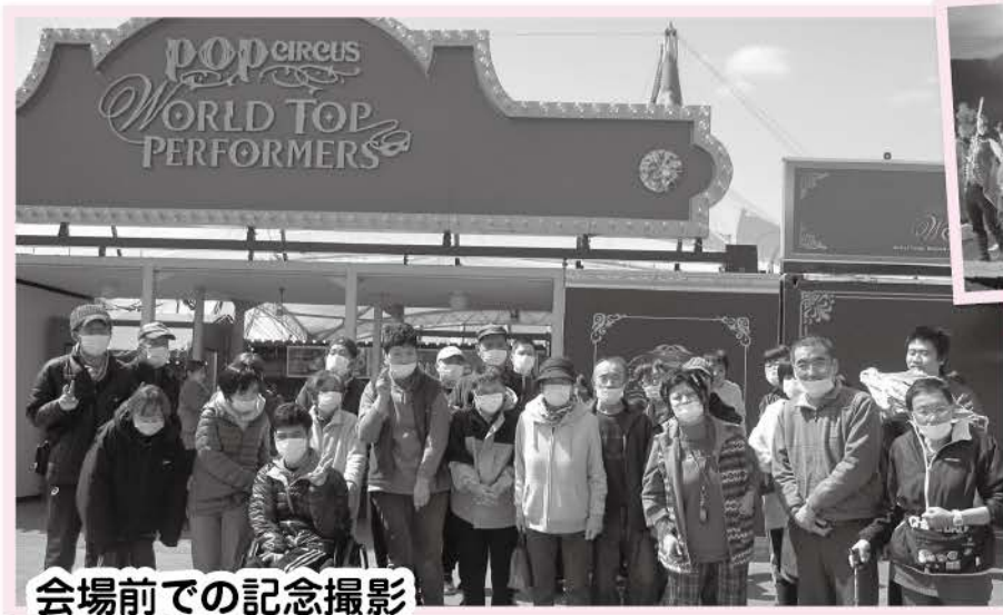
会場前での記念撮影

利用や見学のお問合せについても随時受け付けておりますので、お気軽にご相談下さい。