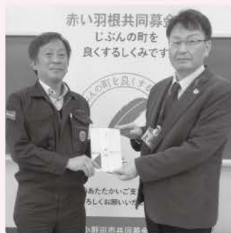
西部石油(株)山口製油所西部ふれあい活動チャリティー活動部 様