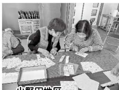
小野田地区 桜山団地サロンの様子