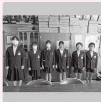
須恵小学校ボランティア委員会 様