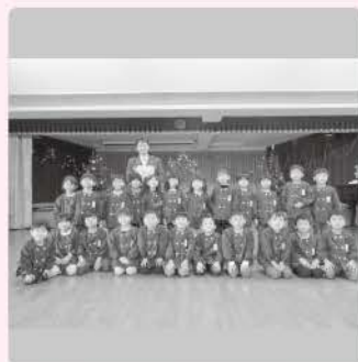
社会福祉法人須恵保育園 様