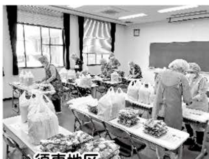
須恵地区 宅配弁当準備の様子