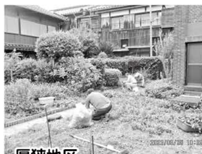
厚狭地区 ネタローお助け隊の作業の様子

「つながりづくり」「見守り」「助け合い」を3本柱とし、安心して暮らし続けるためには…。