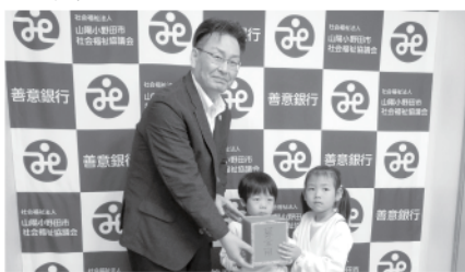
山陽小野田市急患診療所小児科・内科スタッフ一同様 急患診療所終了に伴い 16,502円

匿名様 20,000円 伸宏保育園様 防火もちつき大会の収益として 26,334円