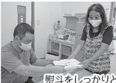
熨斗をしっかりと貼り付けました。