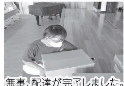
無事、配達が完了しました。