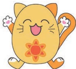
見守りネットワークイメージキャラクター 「どうしちゃん」