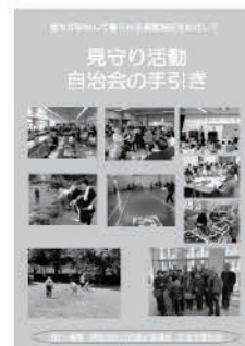
見守り活動の冊子

【お申し込み方法】 下記のいずれかの方法にて7月20日(水)までにお申し込みください。