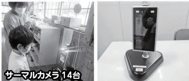
サーマルカメラ 14台

児童クラブでは、サーマルカメラの設置により密に接することもなくスムーズに検温を行い、児童・支援員の更なる感染拡大防止を図り、児童が安心して通所できるように努めてまいります。ありがとうございました。