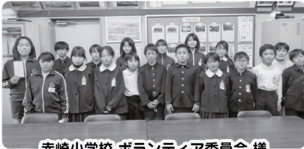
赤崎小学校 ボランティア委員会 様