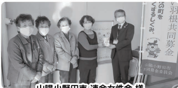
山陽小野田市 連合女性会 様