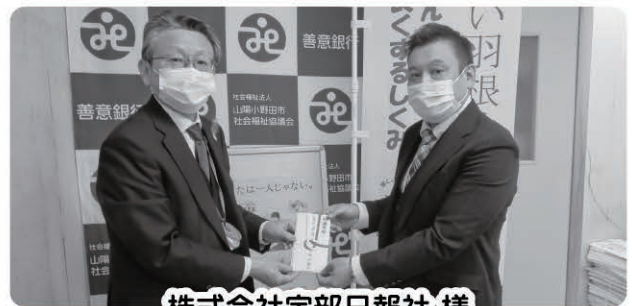
株式会社宇部日報社 様