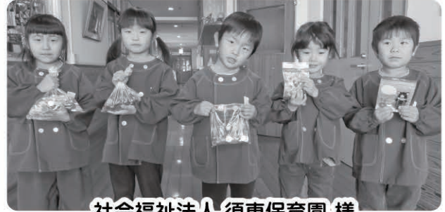
社会福祉法人 須恵保育園 様