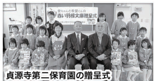
貞源寺第二保育園の贈呈式