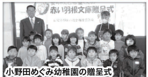
小野田めぐみ幼稚園の贈呈式