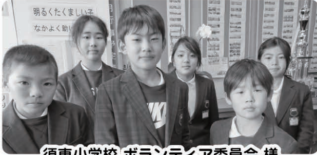
須恵小学校 ボランティア委員会 様