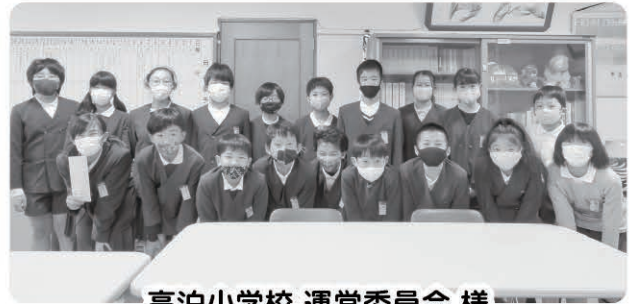
高泊小学校 運営委員会 様