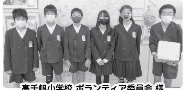
高千帆小学校 ボランティア委員会 様