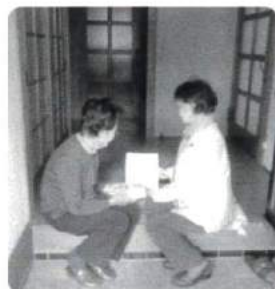
見守り活動の様子 (撮影日:令和元年12月)

アンケート調査は、地域の困りごとや既にある取組みなどを知る上での重要な取組みと言えます。アンケート調査の方法や支え合い活動についてのお問合せは、市社協(地域福祉課サテライト)までご連絡ください。