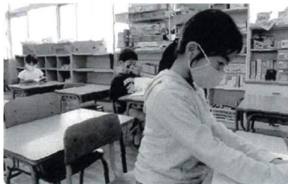
厚陽児童クラブの児童が利用しています。

マスク不足の中、たくさんのマスクのご寄付をありがとうございました!! いただいたマスクは、福祉施設や、児童クラブ利用の児童等に渡しました。 とても喜ばれていました。ご協力ありがとうございました。