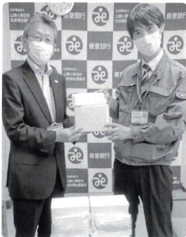
有限会社アシスト 様 マスク2,000枚