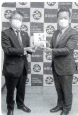
高山青年部会長 様