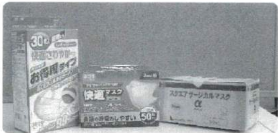
小川 和孝 様 マスク170枚