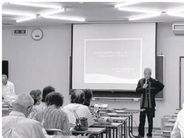
生活支援協力隊の発起式の様子