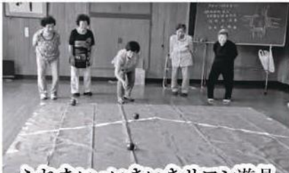
ふれあい・いきいきサロン遊具

昨年皆様からお寄せいただいた募金は、地域の福祉・高齢者の福祉・ボランティア活動や子どもの福祉等、身近なところで福祉活動に役立てられています。