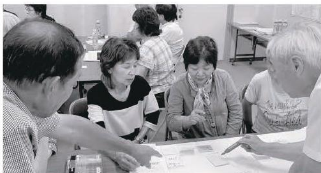
地域課題についての話し合いの様子(高泊)