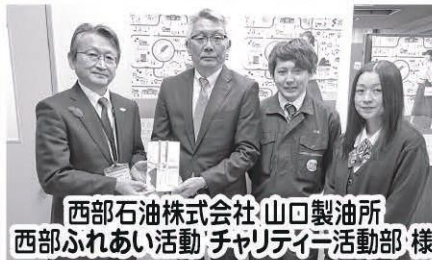
西部石油株式会社 山口製油所 西部ふれあい活動 チャリティ活動部 様