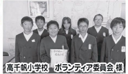
高千帆小学校 ボランティア委員会 様

多くの市民の皆様、企業、学校、施設、団体等から歳末たすけあい募金として、心温まる善意をお寄せいただき、誠にありがとうございました。