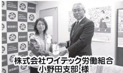
株式会社ワイテック労働組合 小野田支部 様