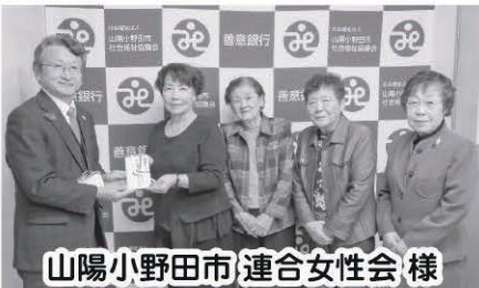
山陽小野田市 連合女性会 様