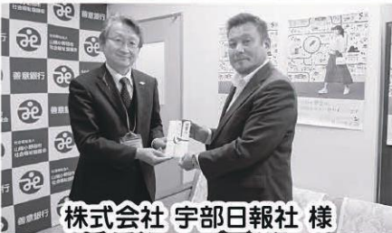
株式会社 宇部日報社 様