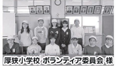
厚狭小学校 ボランティア委員会 様