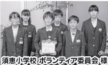
須恵小学校 ボランティア委員会 様