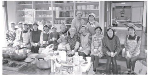
美味しい物作って楽しんでいますよ♪

サロンの参加者が高齢化し、デイサービスや施設に入所され、通常のサロン活動ができにくくなったので、大きく方向転換。世話人18名で子ども会、老人クラブ、自治会の行事のお料理を作り始めました。世話人もサロン参加者として、お料理作りで交流を深めています。