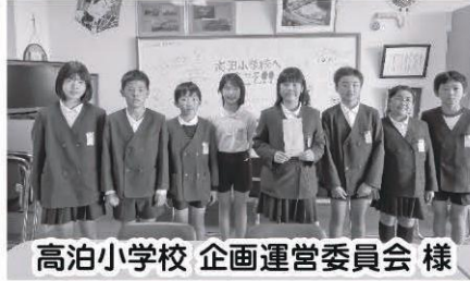
高泊小学校 企画運営委員会 様