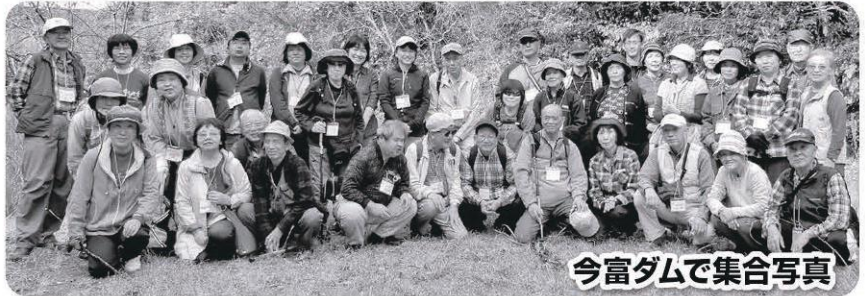
今富ダムで集合写真