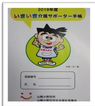
2019年度のサポーター手帳

(振込で交付金を受け取られた方については、このサポーター通信に同封しています。) 今年度2019年度の手帳にシールの貼り付けをお願いいたします！